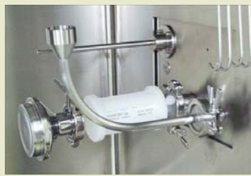
隔离器内采样2-固定位置，节省有限的空间