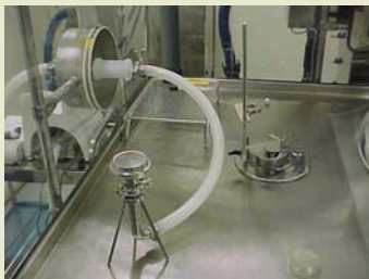
隔离器内采样1-可方便取一定区域内的样品